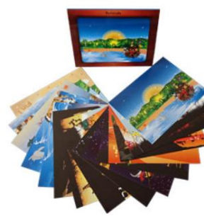
Kamishibai côté illustration

Des histoires Kamishibais sont disponibles à la bibliothèque Part-Dieu. Pour le butai, 1 seul exemplaire est disponible à l'association car assez coûteux (en moyenne 70 € en bois).