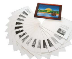
Kamishibai côté vignette et texte

Appels aux bricoleurs ou apprentis en menuiserie qui pourraient nous en fabriquer quelques exemplaires comme thème de réalisation de fin d'année. Patron et mode d'emploi à disposition !