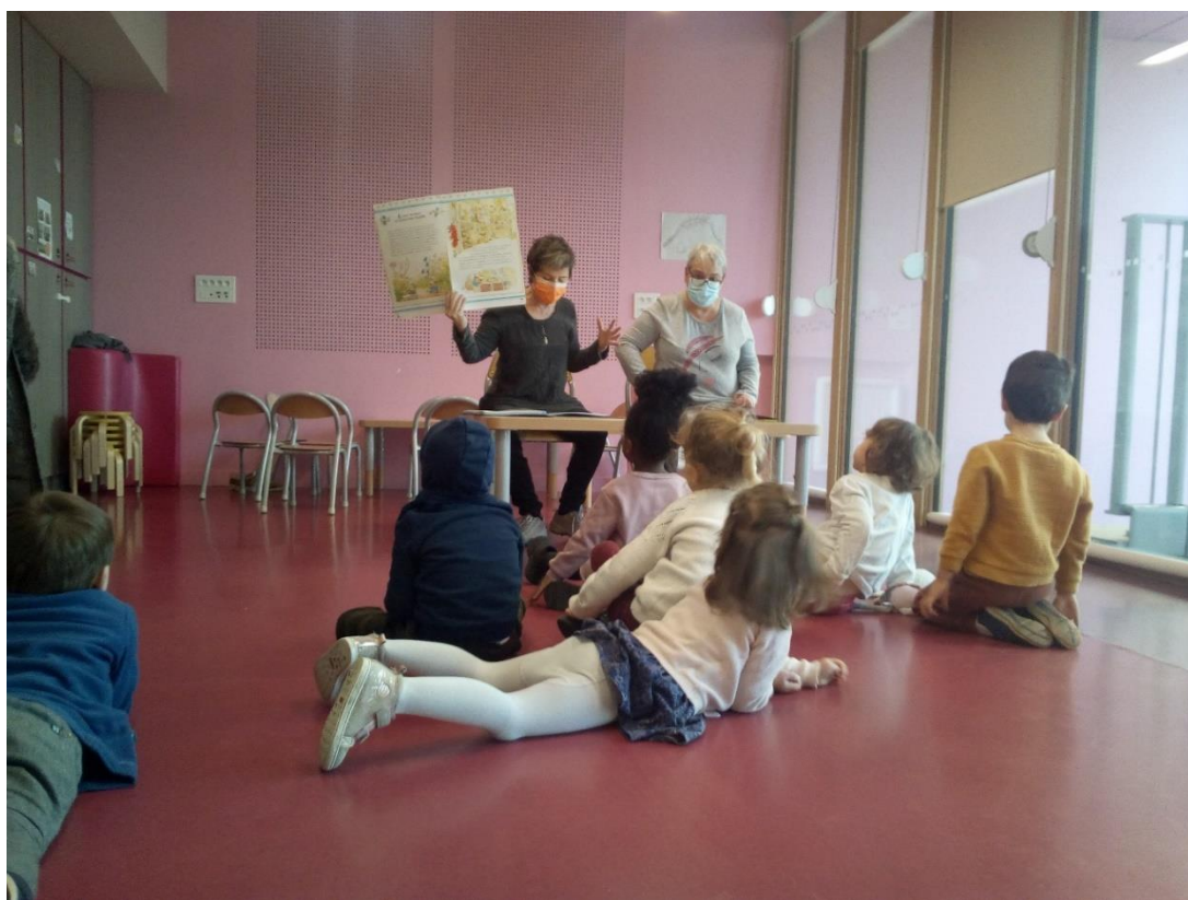
Lectures à la maison de l'enfance (rue Paul Bert) pendant les vacances de Noël